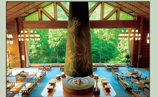
奥入瀬溪流ホテル

奥入瀬溪流のほとりに立つ北欧風のホテルです。八甲田の山々を望む展望大岩風呂、木々に囲まれた溪流沿いの露天風呂に浸かってゆっくりとお過ごしいただけます。ラウンジには岡本太郎氏制作の巨大暖炉「森の神話」や遺作の「河神」が目を楽しませてくれます。朝夕は溪流沿いに広がる庭園で、澄んだ空気と溪流の瀬音にて身をゆだねて下さい。